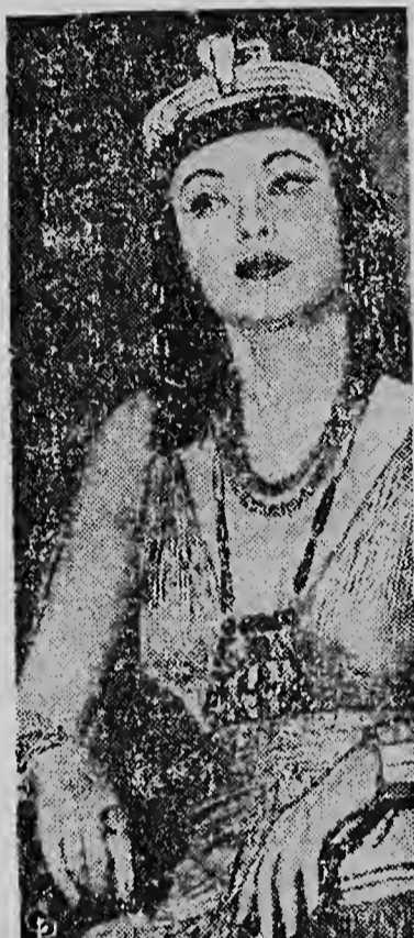
GENE TIERNEY is shown on a Hollywood set wearing an Egyptian costume which drew compliments from Prince Aly Khan, with whom she has recently been romantically linked. Aly, who is something of an Egyptologist, declared authentic the jewelry and apparel she is using.

ta un baila masha anima y ta stranja Cox hopi ta con e no a worde introduci ainda na America. Mas o meos 80 procento di nos bishita-nan ta hende di estado Unidos, asina e senyor y senjora Messina, donjo di Boca Chica, un otro hotel popular di sto. Domingo ta bisa.